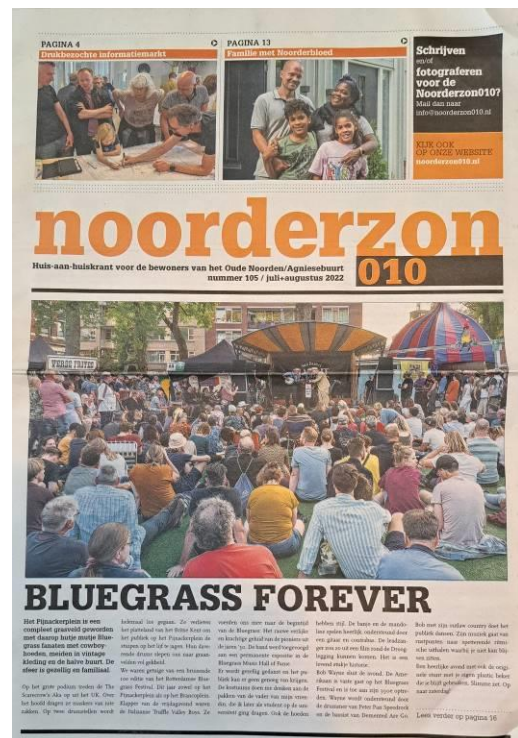
Foto's: Lovende artikelen, nationaal in De Telegraaf en AD en lokaal in de Noorderzon