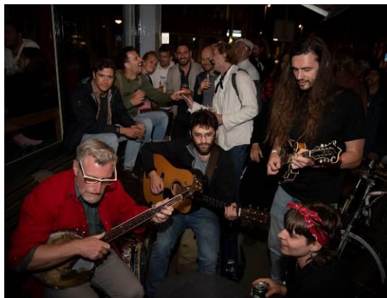
Foto's: Jamsessies in de Jam area en 's avonds spontaan bij de Horeca.