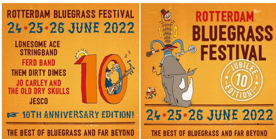
Campagne uitingen Rotterdam Bluegrass Festival 2022

In het Oude Noorden worden sowieso alle straten tussen de Noordsingel en de bergweg huis aan huis geflyerd. Niet werd geadverteerd in de lokale edities in (alle randgemeenten van Rotterdam) van het AD. De bezoekers uit Zuid-Holland zijn sneller geneigd op het laatste moment te beslissen naar het festival af te reizen. Ook werd de nadruk gelegd op het feit dat het festival gratis toegankelijk is. In samenwerking met de online campagne heeft dit tot 20% nieuwe bezoekers geleid.